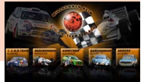
Die neu gesdaltete Startseite der CTF-Homepage. Sieht doch gleich besser aus!

Leider können wir diesen Service nur Mitgliedern mit Mail-Adresse bieten. Vielleicht ein Grund Internet zu installieren und online zu gehen.