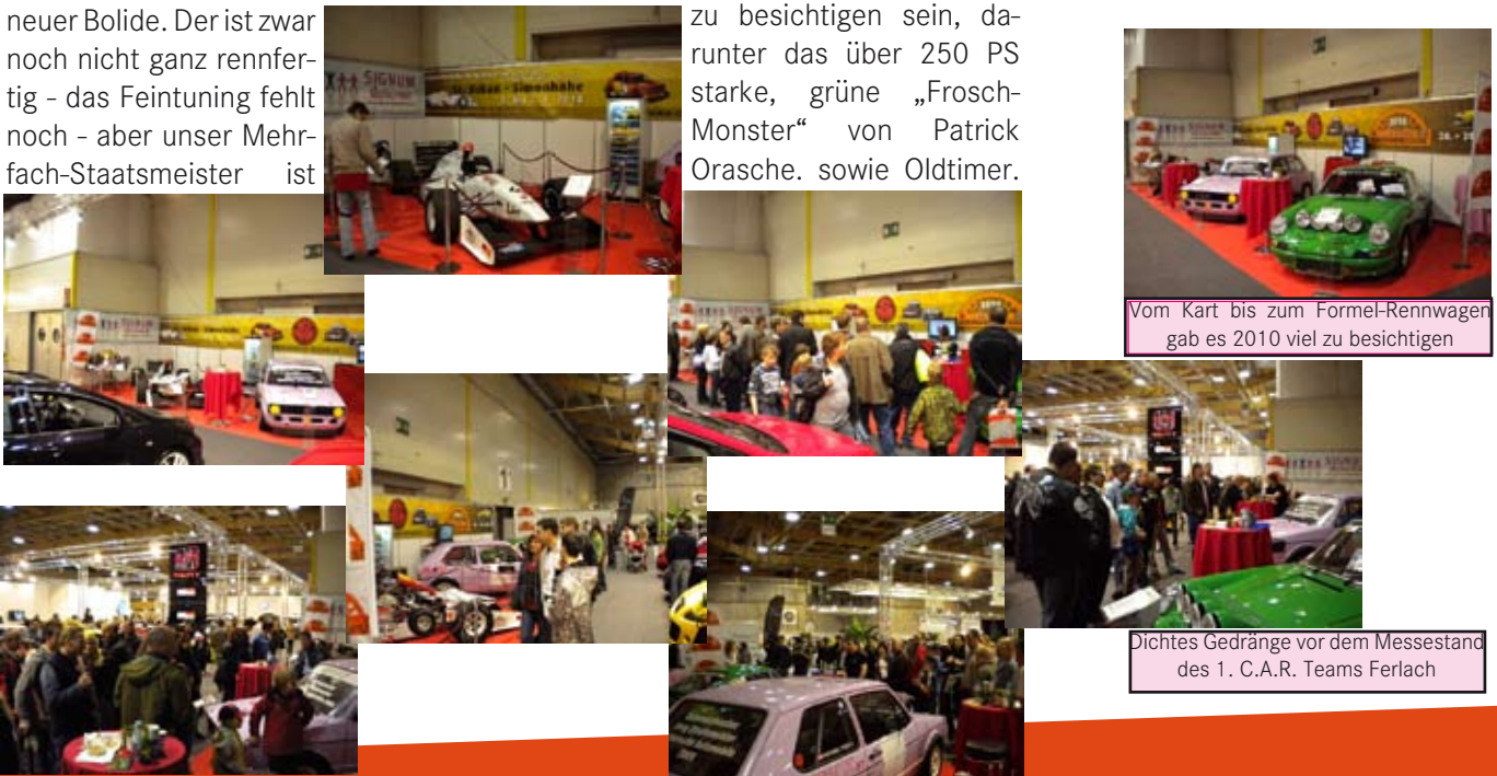
Vom Kart bis zum Formel-Rennwagen gab es 2010 viel zu besichtigen